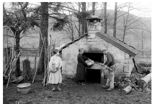
Four à pain

Le TISSERAND est l'artisan du vêtement et des tissus. Il utilise le lin dont voici un bref aperçu de sa fabrication: A maturité, il est arraché et ensuite étendu au sol quelques semaines en "audains" (buttes) pour le faire roussir (le rouissage) et ensuite mis en bottes. Au bout de plus ou moins deux semaines, il sera battu au fléau ("rack" en bois) et ensuite, il y aura le broyage (ou teillage/breillage). On en fait de la "filasse", appelée de l'étope de lin, lequel une fois mis en boudins, sert à