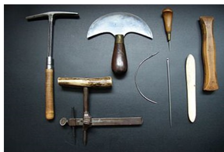
Outils du bourrelier

Le BOURRELIER ou HARNACHEUR est l'artisan qui travaille le cuir et la bourre (laine, grosse toile) afin de réaliser des pièces d'attelage pour le travail des chevaux. Le crin de cheval était utilisé pour rembourrer les sièges de carioles entre autres. Il fabrique également des matelas, licols, harnais, bâches, tabliers, besaces des éleveurs et de bovins.