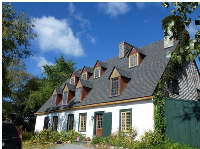
Maison Denis/Maison Grandmere (Classified as a historic monument)