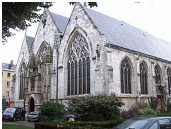
L'église de St-Vivien existait déjà au XII e siècle sous la forme d'une chapelle. Elle prit son aspect actuel au cours des XIV e et XV e siècles avec ses 3 nefs et sans transept.