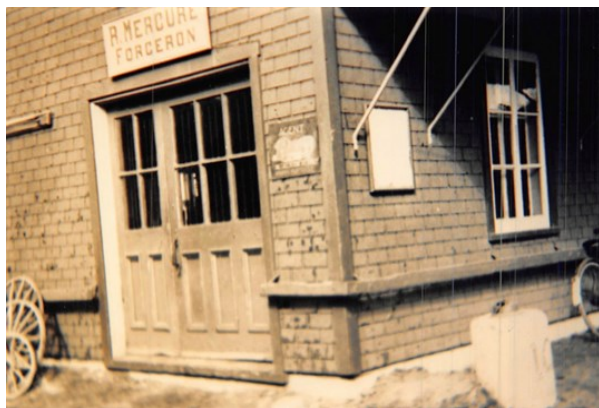
Boutique de forge de M. Raoul Mercure