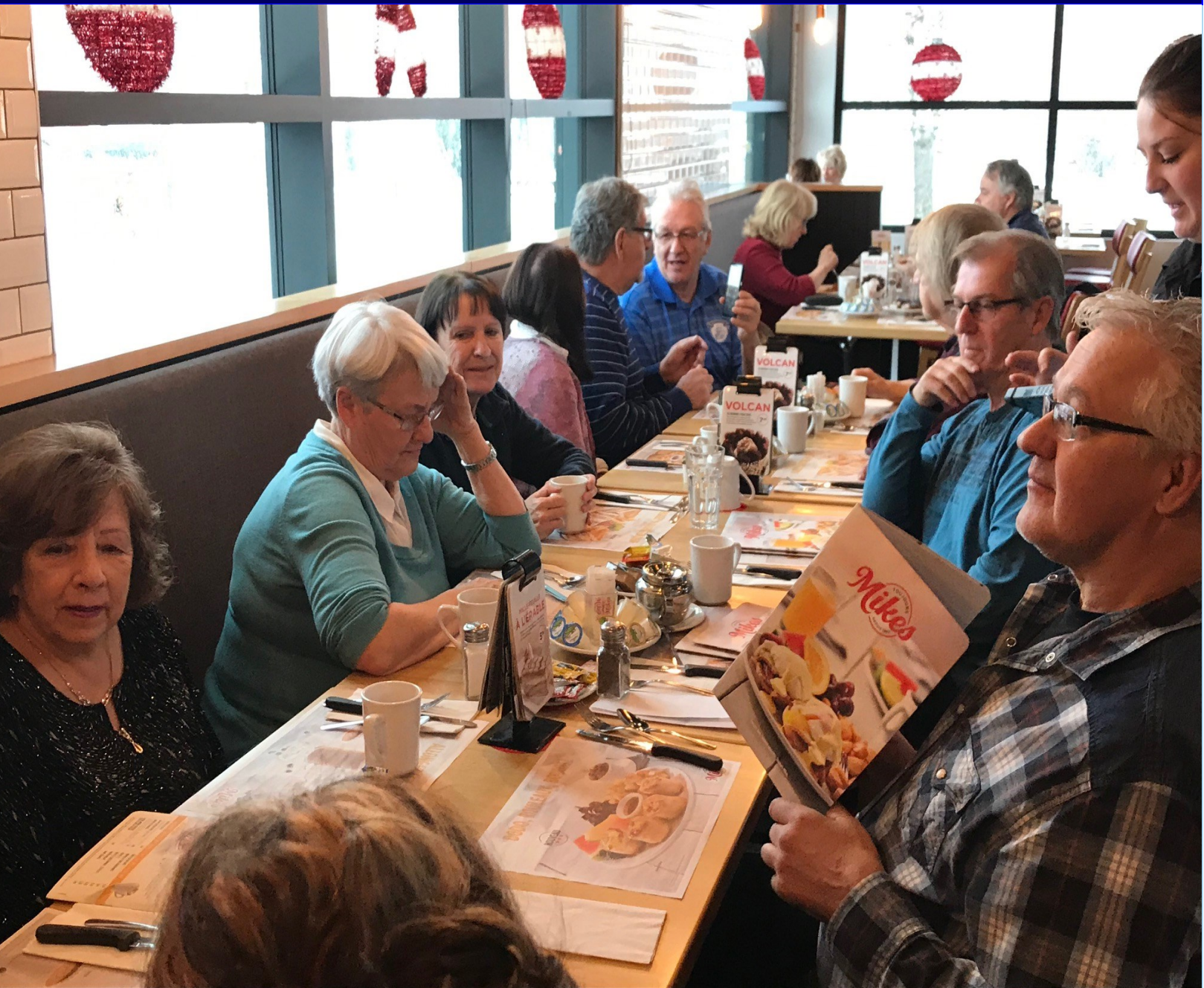
Photo souvenir prise lors du déjeuner-brunch 22 décembre 2019 au restaurant Mike's