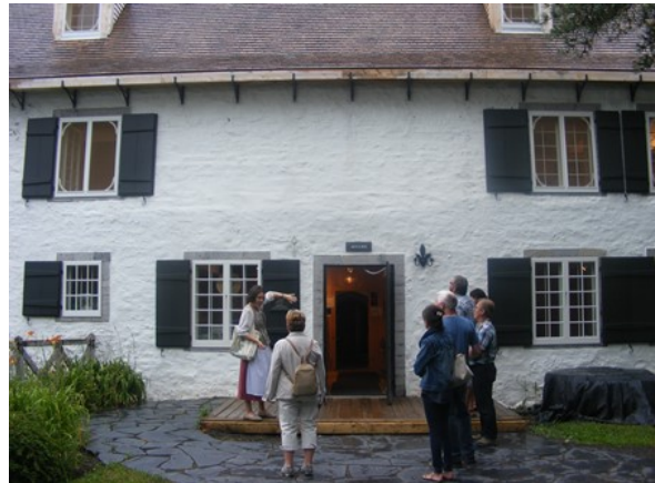
Moulin des Jésuites

L'état de conservation du Moulin ainsi que le four à pain qu'on retrouve à l'extérieur sont impeccables. Le four à pain fût restauré et demeure un attrait fort prisé par les visiteurs. La visite intérieure du moulin s'est terminée par une dégustation de pain de ménage fabriqué selon la recette utilisée à cette époque et cuit dans le four du Moulin. Que de beaux souvenirs de ce moment apprécié de tous.