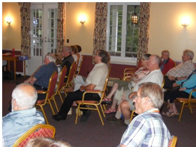
Conférence sur les recherches effectuées de la présence de Nicolas Matte à Charlesbourg vers 1666