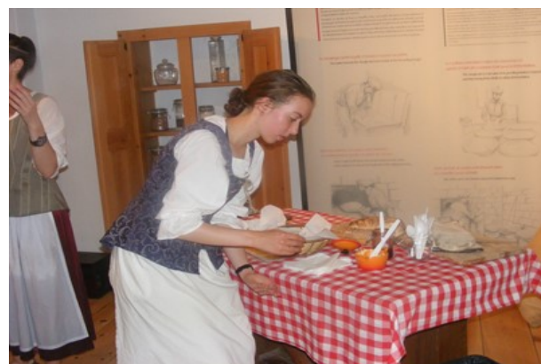
Dégustation de pain provenant du four à pain extérieur du Moulin des Jésuites