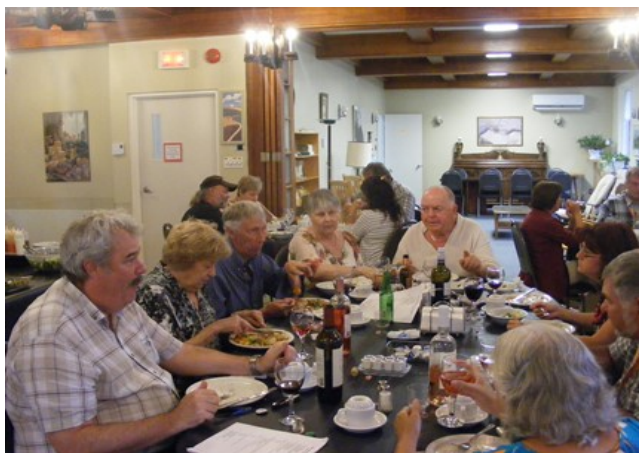
Plusieurs Matte en grande conversation