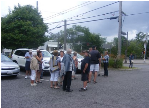
Arrivée de plusieurs participants au rassemblement

De retour au Moulin des Jésuites, plusieurs guides en costume d'époque étaient sur place pour nous accueillir et nous faire découvrir le volet historique de ce moulin construit par les Jésuites en 1742. Actif pendant près de 200 ans, cet ancien moulin à eau a cessé de fonctionner en 1940. On y retrouve aujourd'hui un centre d'interprétation historique.